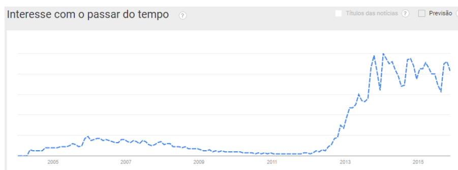
Figura 2. Google Trends Interesse em Cursos Online Abertos e Massivo

Outro fato interessante é que alguns pedidos de patentes refletem a realidade de hoje. Por exemplo, nas patentes focadas no aprendizado de idiomas (“BR 10 2013 001541 5” e “PI 0114992-0”), atualmente, nota-se uma proliferação de plataformas com a mesma finalidade que já geram ganhos financeiros como, por exemplo, o ambiente Englishtown 35 e o aplicativo para celular Duolingo 36 . Por outro lado, as 24 patentes depositadas relacionadas ao principal tema de informática na educação representa uma parcela muito pequena quando comparada com o total. Só em 2015, até outubro, foram depositadas 27.627 patentes no INPI 37 . Destas, nenhuma tem relação com o principal tema de informática na educação. De qualquer forma, o resultado parece animador pois, a academia e inovação convergem em certo ponto.